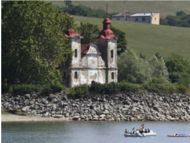
Kostol sv. Štefana

Brehy Domaše zdobí jedna vzácna sakrálna pamiatka. Symbolicky chráni obľúbenú vodnú nádrž a jej obyvateľov či dovolenkárov. Ak ste sa niekedy vybrali na plavbu loďou, iste ste ju neprehliadli. Kostol sv. Štefana je síce opustený, ale naozaj nádherný.